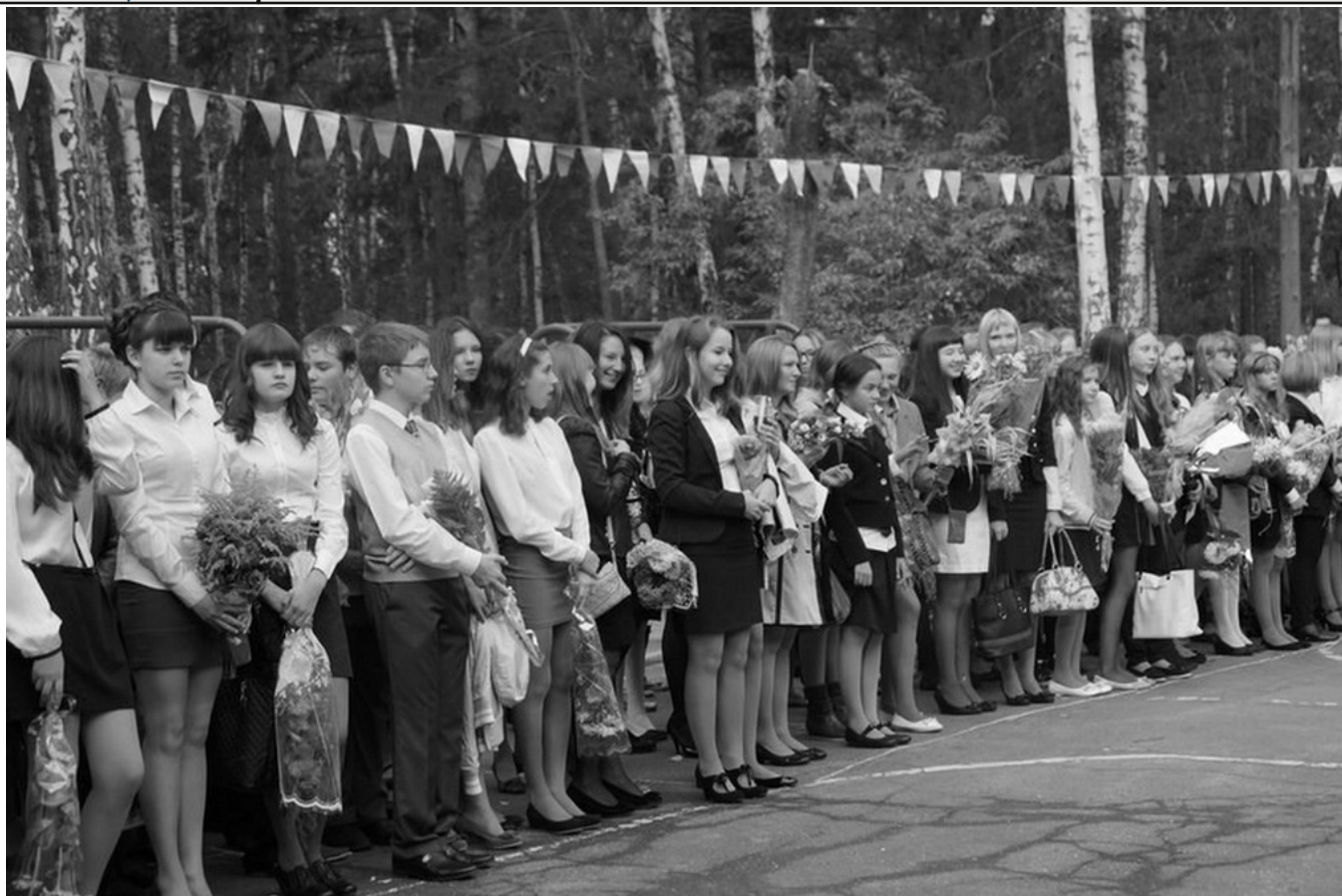
На фото: Праздник Первого сентября в Детском парке